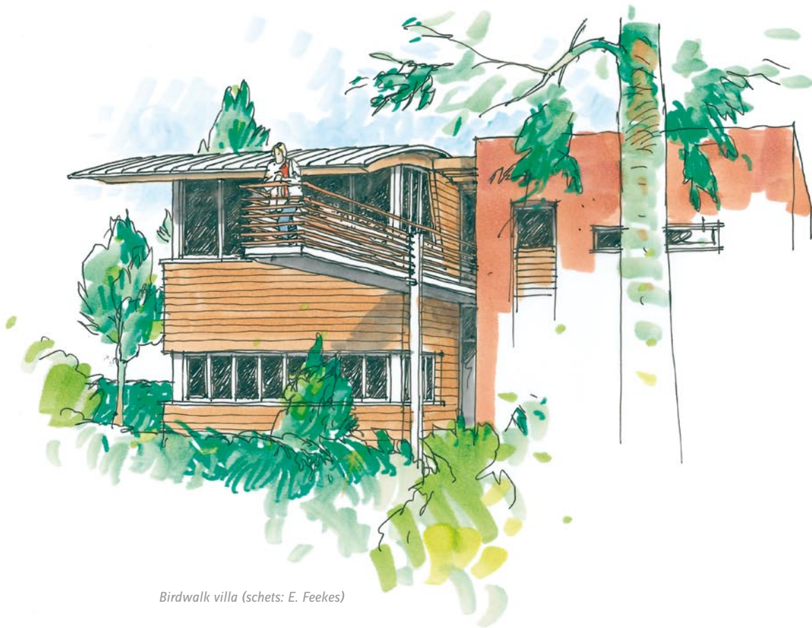
Birdwalk villa