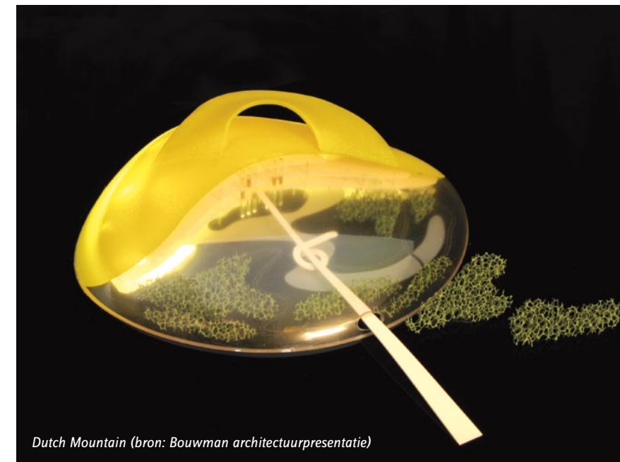
Dutch Mountain (bron: Bouwman architectuurpresentatie)

Het gaat mij in eerste instantie niet om duurzaamheid of energie, het gaat om leefbaarheid, genieten en 'common sense'. De verschijningsvorm van onze ontwerpen is vaak toe te schrijven aan de combinatie van functionaliteit en beleving. Maar ook de verbinding met de plek, de intrinsieke waarde daarvan heeft invloed op onze ontwerpen. Het is altijd mooi om te zien hoe onzichtbare parameters vorm kunnen geven aan een gebouw. Je ziet dit bijvoorbeeld bij het Giraffenhuis en Dutch Mountain, gestapelde 'tuinen met paviljoens' met daarover heen een megakoepel. De koepel weet de windenergie optimaal te benutten, omdat de vorm gebaseerd is op een studie van de lokale heersende windrichting. Door de combinatie van wind- en zonne-energie (passief en actief) genereert de koepel de benodigde energie, garandeert een optimaal binnenklimaat, functioneert als geluidscherm en bevordert synergie tussen de medewerkers.